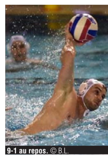
9-1 au repos.